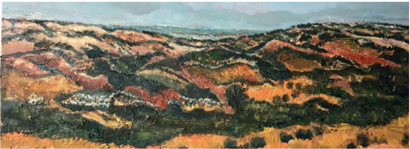
Anke Wijnia, Italië , 2020, acryl & olieverf op doek, 30 x 80 cm.